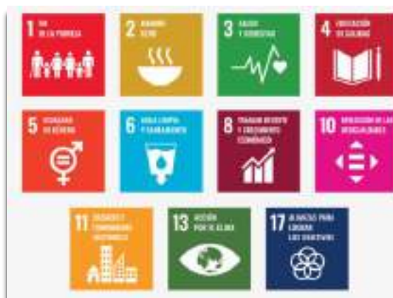
GRÁFICO 1: Objetivos de Desarrollo Sostenibles que promueve Fundación León

Fundación León se alinea con los objetivos de desarrollo sostenible establecidos en 2015 por la asamblea general de las naciones unidas. Específicamente, León contribuye con los siguientes ODS: