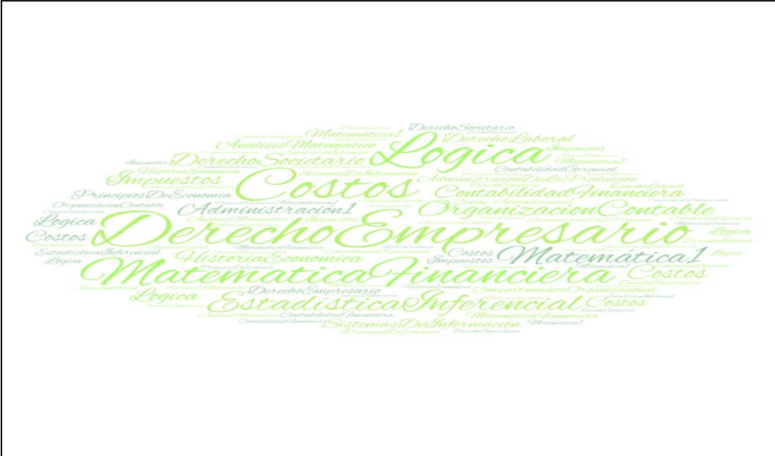
Gráfico N°2: Nube de Palabras de Asignaturas de menor contribución