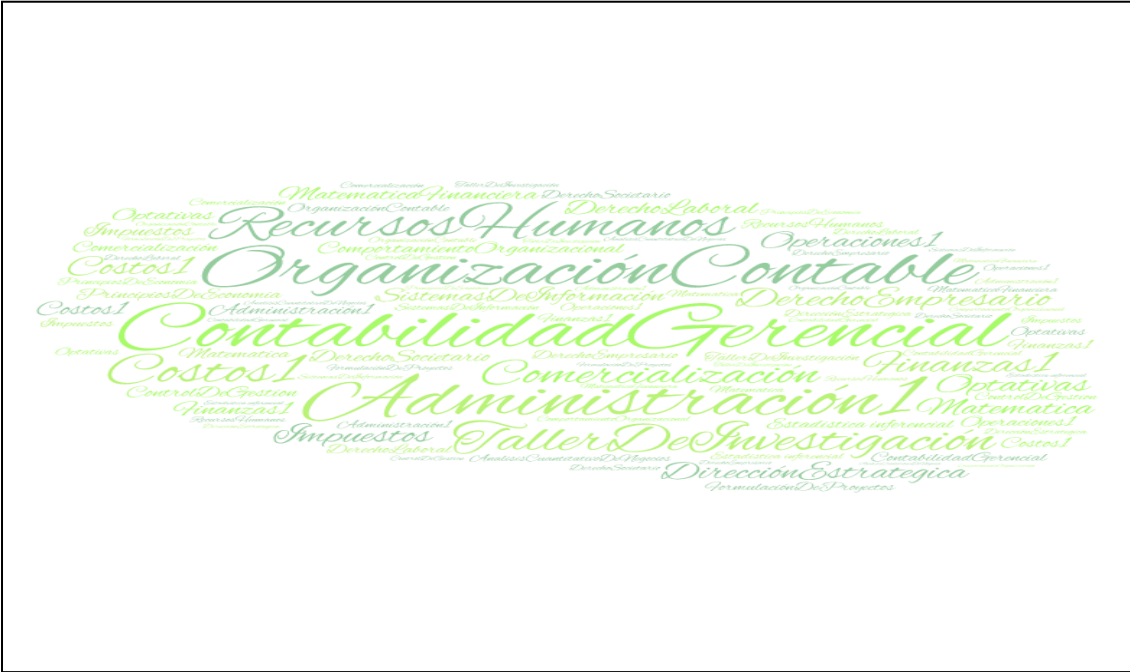
Gráfico N°1: Nube de Palabras de Asignaturas de mayor contribución