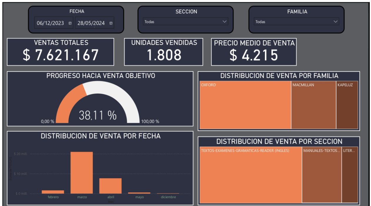
Grafico N°4: Dashboard Interactivo de VCR

de datos fue ajustada y validada, se procedió al desarrollo de un dashboard interactivo utilizando la herramienta Power BI.