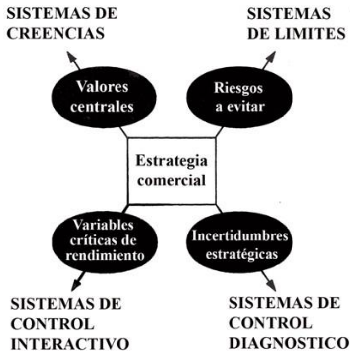
Grafico N°3: Palancas de Control